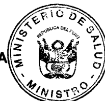
CARLOS ALBERTO TEJADA NORIEGA Ministro de Salud