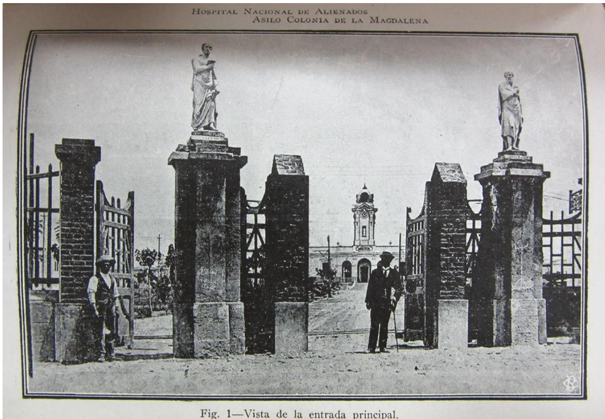
Fig. 1—Vista de la entrada principal.

Tuvieron un importante papel para la edificación del Asilo Colonia la visión reformista de los médicos Baltazar Caravedo, Hermilio Valdizán y Sebastián Lorente, y, sobre todo, el constante apoyo económico del filántropo trujillano Víctor Larco Herrera, quien fue inspector del establecimiento entre 1919 y 1922. Su primer director fue el médico huanuqueño Hermilio Valdizán Medrano, quien ejerció el cargo primero como médico residente entre 1918 y 1920 y luego como director entre 1920 y 1929.