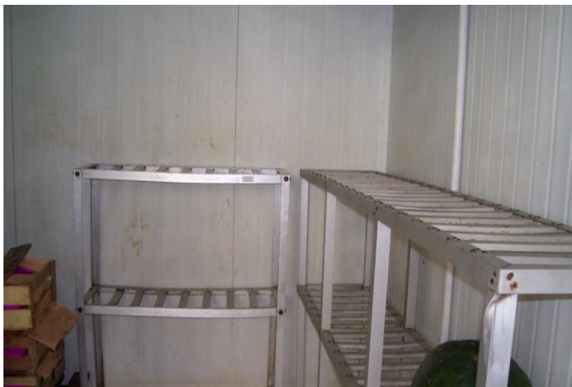
Tarimas de Acero Inoxidable de las cámaras frigoríficas.

De conformidad con el Plan de Vigilancia de Calidad Sanitaria e Inocuidad de Alimentos de Consumo Humano en el HVLH, aprobado mediante Resolución Directoral N° 148-2014-DG-HVLH, se llevó a cabo la primera inspección programada en el 2014 al Dpto. De Nutrición, el cual cumplió con los principios de higiene en los diferentes ambientes, equipos y procesos del citado Departamento.