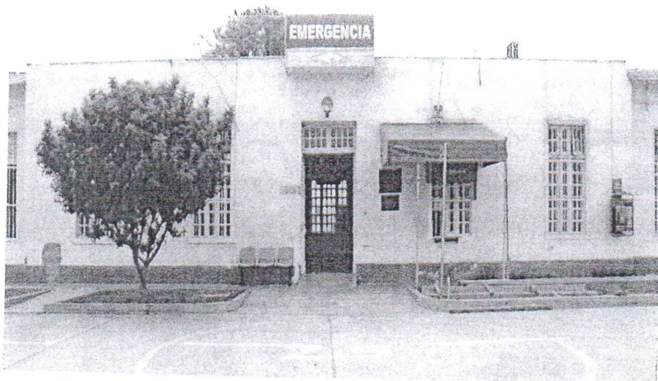
SERVICIO DE EMERGENCIA