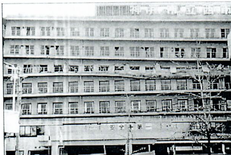
Fotografía 3 Colapso del Cuarto Piso, Hospital Municipal de Kato, 1965

En la historia de la humanidad, los desastres naturales fueron impactantes, destructivos y traumáticos, a pesar de ello, recién después del gran terremoto de San Francisco – EEUU (1906), se iniciaron los estudios de los terremotos y dio inicio a la sismología moderna. En este gran terremotos de San Francisco, se produjo múltiples incendio por rupturas de las línea de gas y cortocircuito; siendo lo que se espera con gran probabilidad en grandes metrópolis.